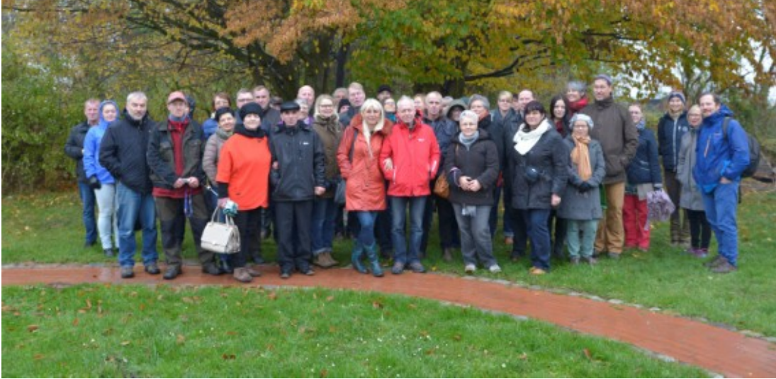
Fyrtårnene og WWF panda'erne.