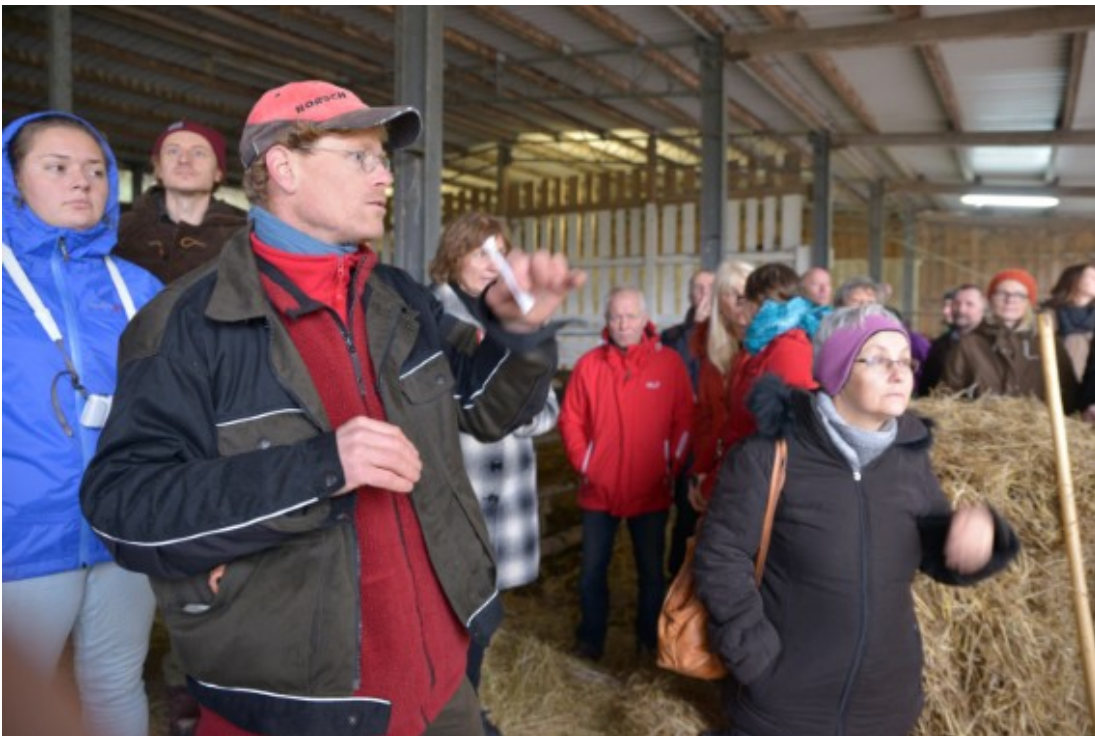
Driftslederen fortæller om beskæftigelsesprojektet på Insel E.V.

På konferencen var der inkluderet et besøg for kandidaterne på Insel E.V. som er et non-profit økologisk landbrug på Rügen. Landbruget er et stort beskæftigelsesprojekt for 120 mennesker med specielle behov. Landbruget giver desuden arbejde til rigtig mange ud over de 120 personer, hvoraf 50 bor på stedet. Det er i projektet vigtigt, at alle medarbejdere har et meningsfuldt arbejde i det daglige. Derfor har landbruget mange arbejdsområder, bl.a. mange forskellige husdyr, mark- og skovbrug, gartneri og eget bageri. Staten støtter projektet, men medarbejderne skal via de producerede produkter tjene deres egne lommepenge ved salg af disse. Derved har alle et godt incitament for arbejdet i det daglige.